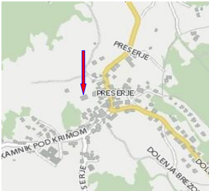
Prikaz lege objekta glede na vas.

Pot do poslopja je z vozili možna z stranske ceste na zahodni strani objekta. Opozoriti je treba, da je sama cesta neobremenjena, zato je na cestišču možno puščati vozila.