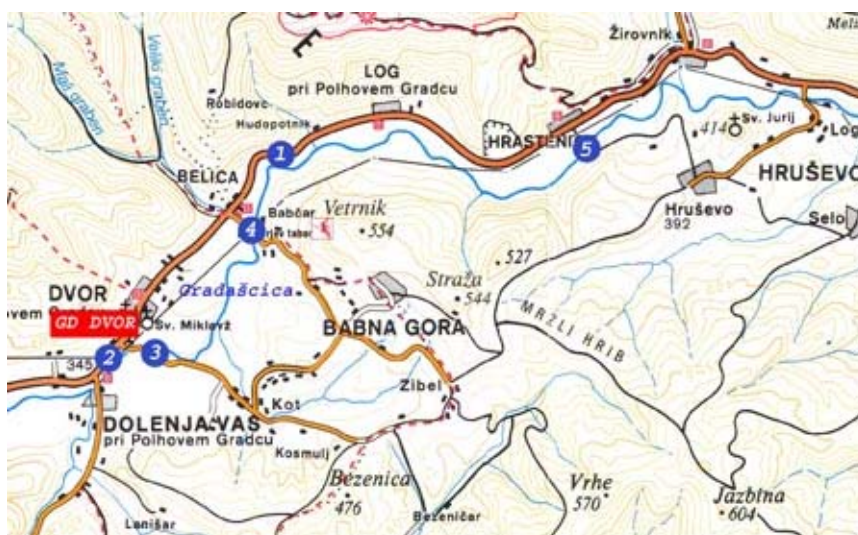
Slika 1: Poplavljeni deli cest zaradi poplavljanja reke Gradaščice

Posredovanje intervencijskih enot ob poplavljanju cest je ena redkih intervencij, kjer se lahko enote na intervencijo na podlagi vremenske napovedi pripravijo vnaprej. Na operativnem območju PGD Dvor zelo pogosto poplavlja reka Gradaščica, občasno pa še nekateri drugi manjši hudourniki (Kotarjov graben, Andrejcov graben, ...). Reka Gradaščica praviloma skoraj vsako leto v jesenskem času v obdobju večjih padavin poplavi večje travnate površine v vaseh Dolenja vas, Dvor, Belica, Log in Hrastenice ter pet cestnih odsekov. Poplavljeni cestni odseki so vidni na naslednji sliki: glavna cesta Ljubljana – Polhov Gradec v kraju Log (1) in Dvor (2) ter lokalne občinske ceste Dvor – Dolenja vas /novi del/ (3), Belica – Babna Gora (4) ter Hrastenice – Hruševo (5). Glej naslednjo sliko.